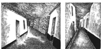
Visions surréelles des venelles de l'Île, murs dans lesquels on voit ses songes